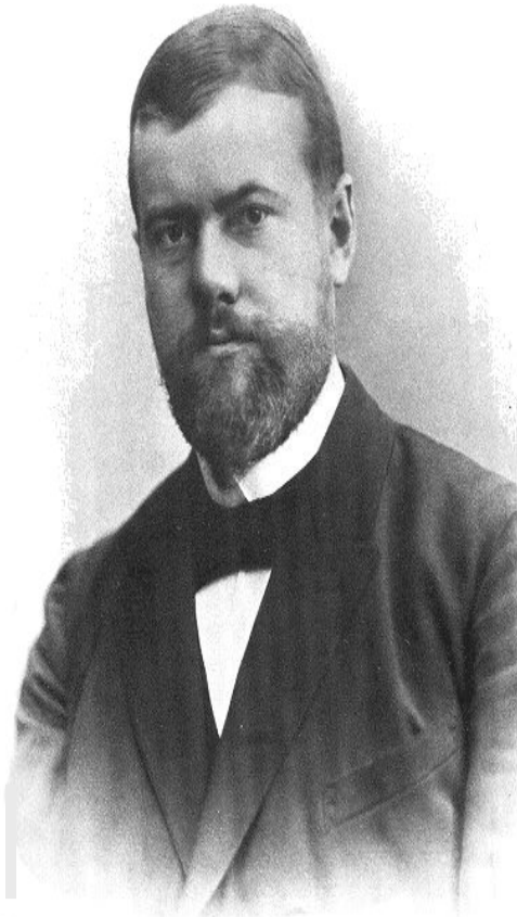
Max Weber (1864-1920)

Weber alegaba la necesidad de elecciones populares libres que permitieran la emergencia de nuevos liderazgos políticos. El sistema Bismarck funcionó con cuatro bases de poder que Weber define de la siguiente manera: 1) Bismarck mismo, como líder político carismático; 2) la monarquía, prusiana en su mayoría; 3) la burocracia y 4) el parlamento.