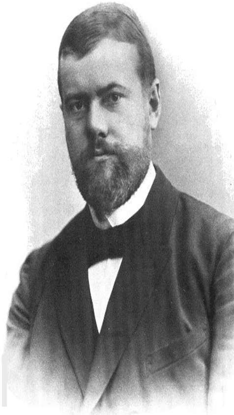
Max Weber (1864-1920)

Weber alegaba la necesidad de elecciones populares libres que permitieran la emergencia de nuevos liderazgos políticos. El sistema Bismarck funcionó con cuatro bases de poder que Weber define de la siguiente manera: 1) Bismarck mismo, como líder político carismático; 2) la monarquía, prusiana en su mayoría; 3) la burocracia y 4) el parlamento.