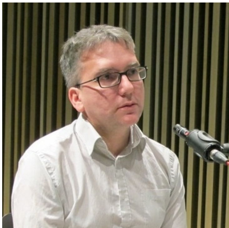
Mark fisher.

Fisher se involucró en una teoría que no solo describiera el mundo tal como es, sino que pudiera intervenirlo, cambiarlo, por lo que no dudó en cruzar los límites restrictivos entre campos académicos que parecen cada vez más desactualizados, en un mundo que se está volviendo cada vez más complejo e interconectado. De hecho, en un mundo donde el capitalismo sigue marchando, y donde el marxismo político y cultural es denunciado como extremo, peligroso y totalitario por la derecha, claramente se necesitan visiones ambiciosas de un orden social diferente para contrarrestar estas fuerzas conservadoras globales. Obviamente, aquí es donde el trabajo de Mark sigue siendo importante.