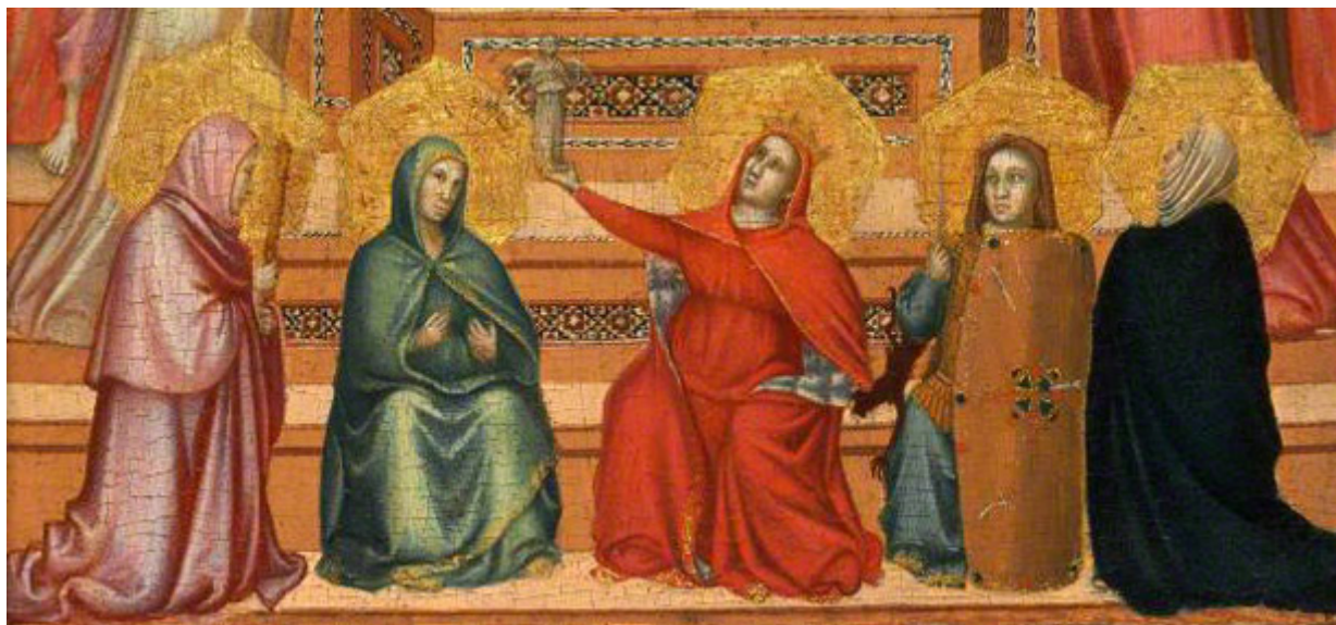
The Virgin and Child with Saints and Allegorical Figures (detalle). Colección Privada.

Las artes nacieron con GIOTTO (1267-1337), él inició un cambio, después de la larga etapa de un feudalismo cuyo arte religioso poco tenía que ver con la belleza, gracias a que la iglesia prohibía la exhibición del cuerpo humano desnudo; en este momento histórico se retomaron los ideales naturalistas y de belleza provenientes de Grecia y de Roma.