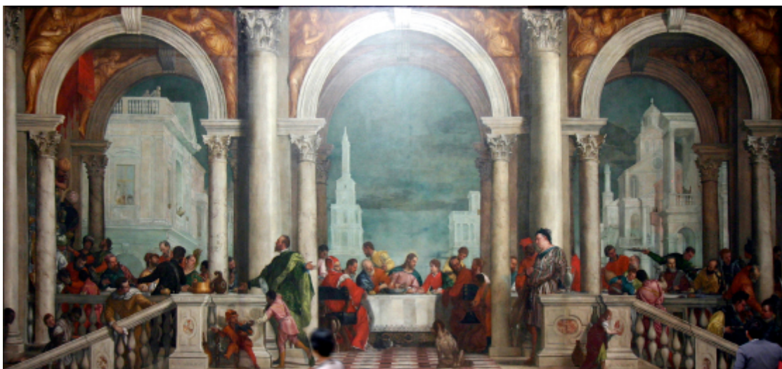
Cena en casa de Leví

En el mural aparecen, además de Jesús y sus doce apóstoles sentados a la mesa, una treintena de personajes invitados a la cena. Aparecen soldados alemanes visiblemente borrachos, algunos moros, un bufón con un papagayo, un ciervo con sangre en la nariz y hasta un perro deambula por ahí; cuando se los mostró a quienes eran sus clientes, a éstos no les gustó en absoluto. El escándalo fue mayúsculo, fue acusado de herejía debido a sus irreverentes planteamientos y fue aprehendido y llevado ante el temido Santo Tribunal de la Inquisición.