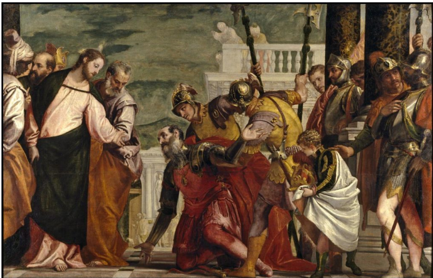
Jesús y el centurión. Paolo Caliari

Junto con Tiziano y Tintoreto, "el Veronés" integró el triunvirato que con su trabajo, fundó lo que hoy se conoce como LA ESCUELA DE PINTURA DE VENECIA.