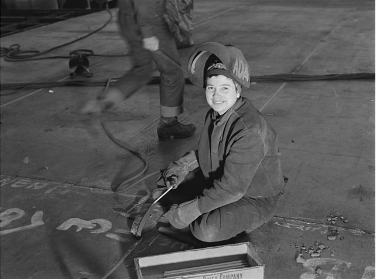
Wendy The Welder (Wendy La Soldadora).

normalmente reservadas a los hombres. Dentro de la propaganda, se dio particular realce a Rosie The Riveter (Rosy La remachadora) y Wendy The Welder (Wendy La Soldadora), imprimiendo carteles de pin-up de ambas. Ahora se ponía sobre la mesa si, inexpertas, las mujeres soldadoras eran responsables de las fallas catastróficas de estos barcos. Fue más que justo que precisamente una mujer desentrañara el misterio.