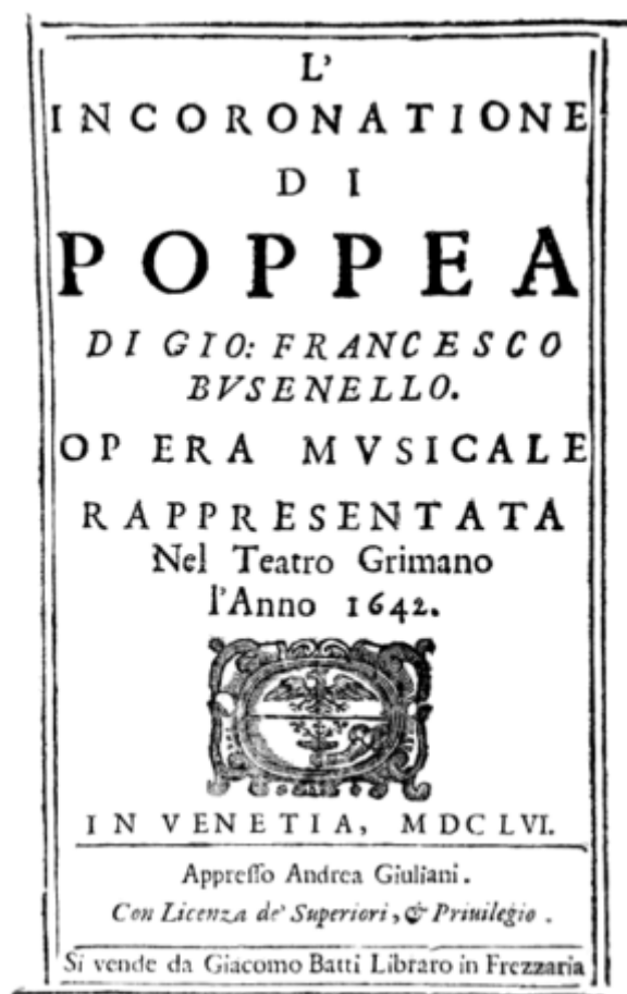
L'incoronazione di Poppea

L'incoronazione di Poppea se estrenó en el Teatro SS. Giovanni e Paolo a principios de 1643 y tuvo un gran éxito, como lo atestiguan todas las representaciones que tuvo en toda Italia en la década de los 1650s.