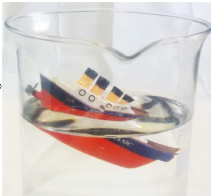
Fig.1: El Titanic hundiéndose, experimento preparado por F. Bagnoli en el marco "la fisica di tutti i giorni"