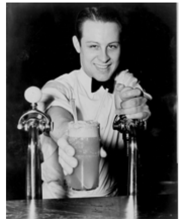
Figura 2. helado al refresco

En este cómic, Donald y sus sobrinos tienen que competir contra Gilberto Oro (Flintheart Glomgold) para entregar un helado "con refresco" (ice cream soda) al presidente de Cuadrolandia (Plain Awful) y rescatar a su tío Rico MacPato, detenido por "hacer formas redondas". En Cuadrolandia todo es cuadrado y hacer cosas redondas constituye un crimen inimaginable. MacPato, pretendiendo inculcar el amor al dinero a los ingenuos cuadrolanderos, muestra su primera moneda y termina condenado a trabajos forzados. Gilberto, por supuesto, traiciona el acuerdo previamente establecido tras haber conseguido el helado, lo que obliga a los chicos a fabricar un refresco helado de emergencia allí mismo, utilizando leche en polvo, azúcar y chocolate de sus raciones de comida, congelando los ingredientes mezclando sal y nieve, y finalmente reemplazando el refresco con el agua carbonatada de un extintor de incendios.