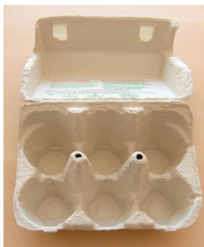
Figura 5. huevera de cartón

Se puede ilustrar experimentalmente el problema con una huevera de cartón (Fig. 5) y unas cuantas bolitas. Las abolladuras de la huevera representan los mínimos de la energía.