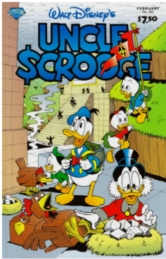
Figura 1: Regreso a Cuadrolandia (fuente wikipedia)

En este cómic, Donald y sus sobrinos tienen que competir contra Gilberto Oro (Flintheart Glomgold) para entregar un helado "con refresco" (ice cream soda) al presidente de Cuadrolandia (Plain Awful) y rescatar a su tío Rico MacPato, detenido por "hacer formas redondas". En Cuadrolandia todo es cuadrado y hacer cosas redondas constituye un crimen inimaginable. MacPato, pretendiendo inculcar el amor al dinero a los ingenuos cuadrolanderos, muestra su primera moneda y termina condenado a trabajos forzados. Gilberto, por supuesto, traiciona el acuerdo previamente establecido tras haber conseguido el helado, lo que obliga a los chicos a fabricar un refresco helado de emergencia allí mismo, utilizando leche en polvo, azúcar y chocolate de sus raciones de comida, congelando los ingredientes mezclando sal y nieve, y finalmente reemplazando el refresco con el agua carbonatada de un extintor de incendios.