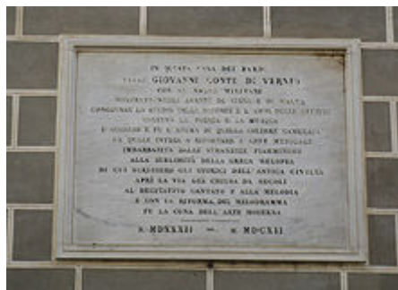
Placa alusiva a la Camerata en el frente del Palacio Bardi de Florencia

Entre quienes estuvieron a cargo de los intermedios para La pellegrina se encontraba Giovanni de'Bardi quien lideraba un grupo de artistas y diletantes que se reunía en los 1570s y 1580s para discutir el estado de las artes. Este grupo es conocido como la "Camerata". Bardi se trasladó a Roma en 1592 y Jacopo Corsi, empresario cercano al Gran Duque Fernando I, ocupó su lugar.