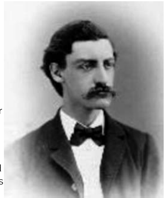
George Atwood, matemático inglés.

Dicha máquina consiste en una polea por la cual se desliza una cuerda que sostiene un cuerpo en cada extremo. Si las masas de los cuerpos difieren, el sistema se moverá con una velocidad variable, siendo la aceleración proporcional a la diferencia de las masas. Pero de acuerdo con las ideas de Einstein, esa aceleración que "siente" el cuerpo es equivalente a una variación de la fuerza de la gravedad. Para entender esto, recordemos qué se siente en un ascensor rápido que comienza a ascender o descender en un edificio (al comenzar el ascenso, nos sentimos "más pesados"; al comenzar a descender, "más ligeros").