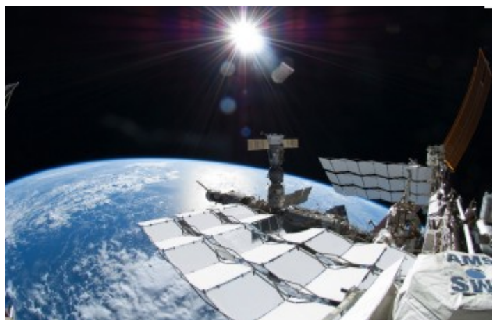
Imagen 1. Imágenes desde el exterior del planeta (ISS).

Para los estudiosos que trabajaban con esta idea, la oscuridad nocturna pronto empezó a plantearles problemas conceptuales profundos y enormes contradicciones. La mayoría pensaba que si el Universo era infinito, como sucedía en realidad según sus convicciones y experiencias, dado que el espacio es transparente sería suficiente que llegase a la Tierra un rayo de luz procedente de cada estrella para que el cielo estuviera siempre iluminado, de día y de noche.