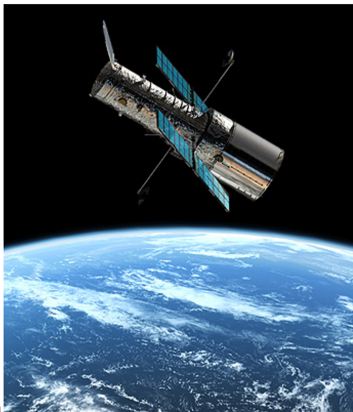
Imagen 2. Tomada por un telescopio espacial

Aunque en gran parte de la literatura científica actual (no relativista) la oscuridad en ausencia del Sol se suele atribuir al efecto Doppler y al "corrimiento hacia el rojo" (Imagen 3) que hace que la radiación procedente de las galaxias lejanas no pertenezca al espectro óptico. Harrison, como se ha señalado en el párrafo precedente, demostró que la razón principal es que no hay suficiente número de estrellas en el Universo y además el tiempo de vida de las galaxias es muy corto, así que el efecto Doppler es una razón de segundo orden. En otras palabras, la oscuridad nocturna podría ser una prueba de la edad finita del Universo.