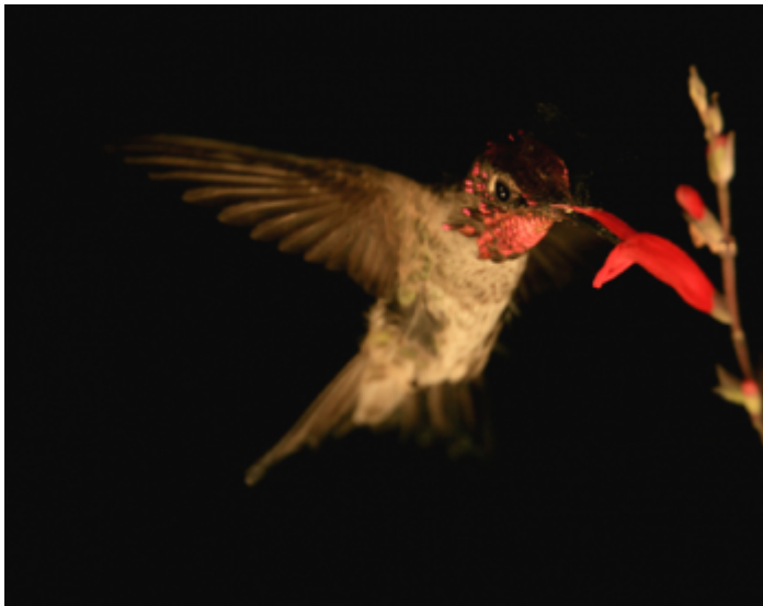
Figura 1. Colibrí ( Calypte anna ) tomando néctar con granos de polen flotando sobre su cabeza.

Para las plantas, la energía gastada en producir néctar lamentablemente nunca se recupera. Sin embargo, tanto sacrificio se ve recompensado con creces al hacer de los colibríes cupidos y mensajeros de su misiva amorosa (Figura 1). El polen, anclado al pico y cabeza de los colibríes, será llevado a cientos de prometidas potenciales en un sólo día. Con tanto amor de por medio es entendible que las plantas derrochen tanta energía en atraer a sus polinizadores.