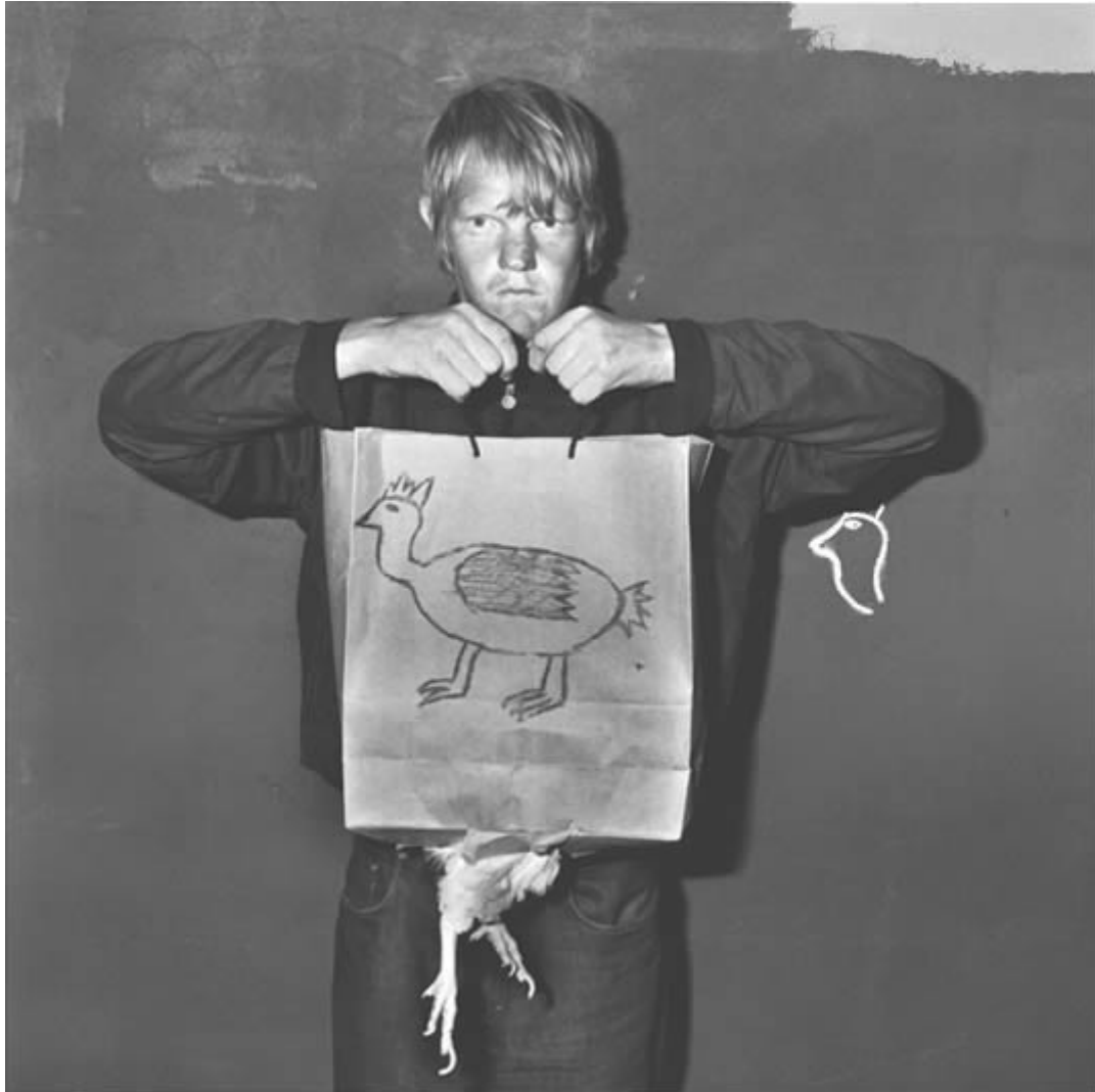
Roger Ballen, Broken bag, 2003

no es impedimento para que, otros o él en otros casos, recurran al color para hacernos ver, a través de la manifestación de las cosas, su esencia.