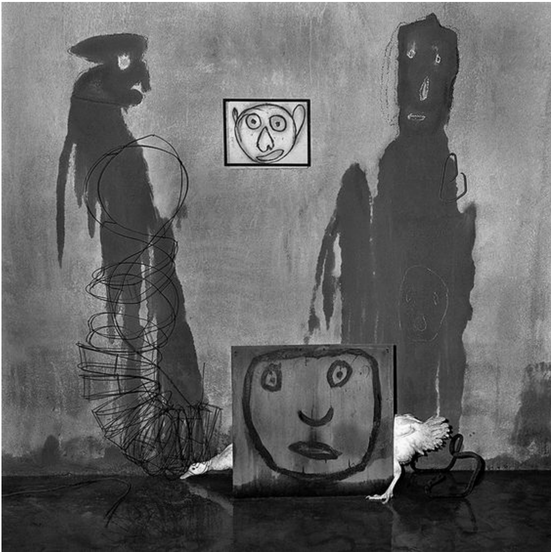
Roger Ballen, Transformation from "Asylum of the Birds" (2004) ©

No se puede negar que la obra de Ballen muestre un ambiente inquietante y claustrofóbico y que las situaciones que presenta causen temor y desasosiego. Pero rechazar su obra solo por su apariencia es impropio del conocedor y, quedarse en la forma, es perder de vista el fondo.