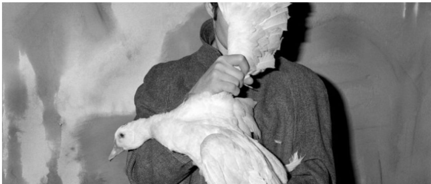
Roger Ballen, Frame from Asylum of The Birds ©

El universo que nos muestra Ballen es esa parte del mundo que la vida moderna ha querido olvidar que existe ya que se nos ha mostrado un mundo idealizado y falso por la parcialidad que se refleja. Pero el mundo, como bien muestran, por ejemplo, las viejas canciones (Gentle Annie, Danny boy, Old black Joe, The wreck of the old 97...), está lleno de tragedia, drama y muerte y esos hechos necesitan ser reconocidos, no ocultados.