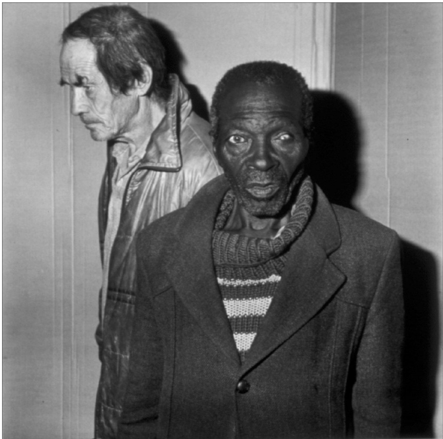
Roger Ballen, Labourers, 1997 ©