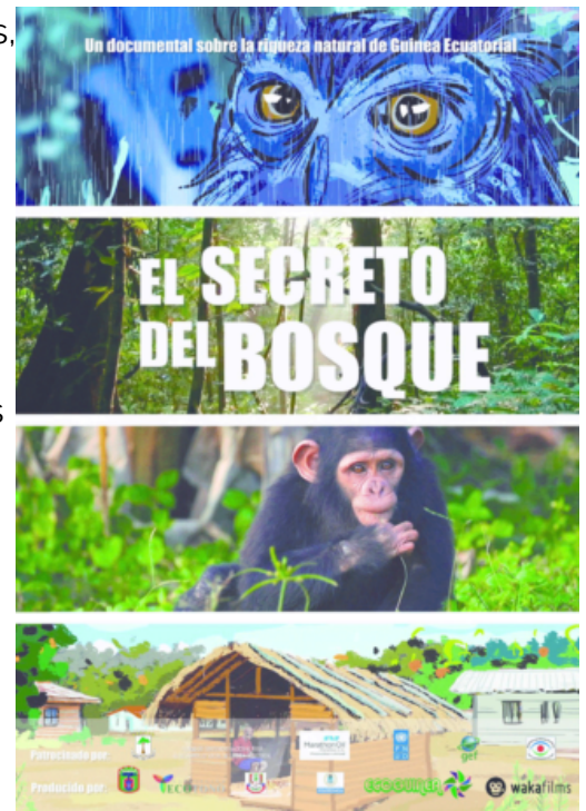
"El secreto del bosque", de Antonio Grunfeld Rius.

Como entretenimiento, como material didáctico o como herramienta de divulgación, el cine científico está demostrando ser un medio poderoso para comunicarse con el público amplio. Es necesario considerar entonces el incremento del uso de esta forma de expresión para crear públicos exigentes de trabajos de calidad, tanto en los contenidos como en la obra audiovisual generada. Este público podrá entonces no sólo adquirir directamente conocimientos científicos, sino comprender el quehacer de los científicos, sus métodos y motivaciones. C 2