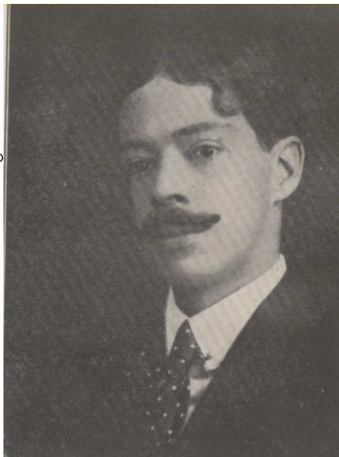
Jesús T. Acevedo. Escritor y arquitecto mexicano.

que este humilde rincón, en el que se filtraban las humedades por el techo de ladrillo abovedado y que era misteriosamente maleable al clima de las estaciones (gélido en el invierno, tórrido en el verano y frío en la primavera y en el otoño), les serviría a los mayores como una contraseña de amistad y consuelo durante el resto de sus vidas, que para Acevedo, muerto en 1918, no sería mucho. Murió en Pocatello, un pueblo perdido entre las montañas de Idaho, Estados Unidos, cuyo nombre quedaría asociado al de Acevedo. Guzmán, entonces en Nueva York, todavía exilado, envió a Reyes, quien seguía en Madrid, expatriado también, un telegrama con la noticia: "Lo de Chucho fue horrible: Texas, verano, influenza, miseria, vicio, desencanto". Reyes preparaba la entrega de un libro en el que incorporó unas palabras de despedida: "Dedico estas páginas finales de El cazador a la memoria de Jesús Acevedo, que sonreía tan amablemente cuando lograba sorprender, como en una vislumbre, el alma confusa de sus amigos".